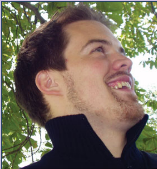
KOMMER: Audun Iversen, vinner av Dronning Sonja Internasjonale Musikkonkurranse 2008.