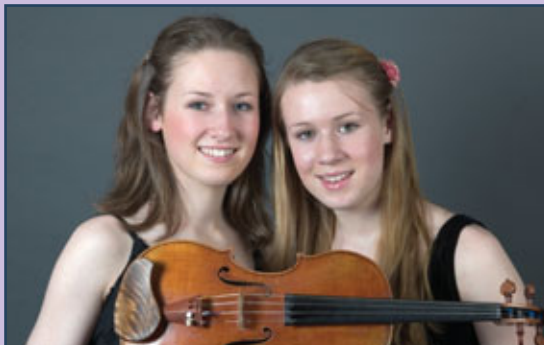
KOMMER: Helsing-søstrene sørger for at det også blir folkemusikk i Godt Musikkår 2008.