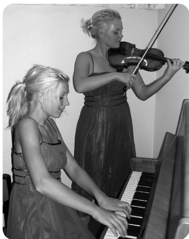
TYPISK: Jentene er i suverent flertall på piano og stryk.