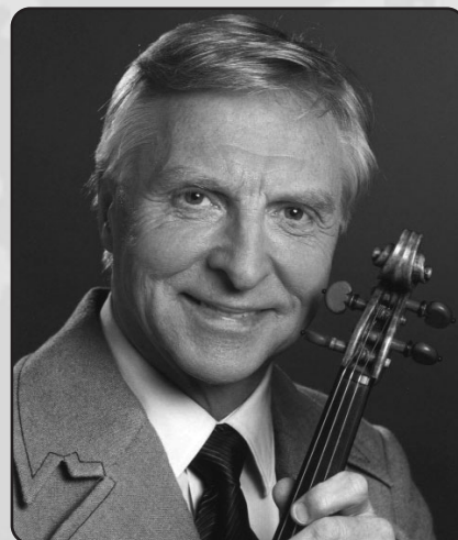
TURNÉ & PRIS: Arve Tellefsen skal på turné med unge kulturskoleelever. Samtidig skal det deles ut en Arvefølgepris på de stedene turneen svinger innom neste år.

De inviterte kulturskole får sjansen til å presentere noen av de beste elevene, gjerne fra ulike aldersgrupper. Kulturskolens innslag vil avslutte konsertens første avdeling. Rikskonsertenes nye strategi bygger på et utvidet samarbeid med det lokale musikklivet hvor kulturskolene er viktige hjørnesteiner.