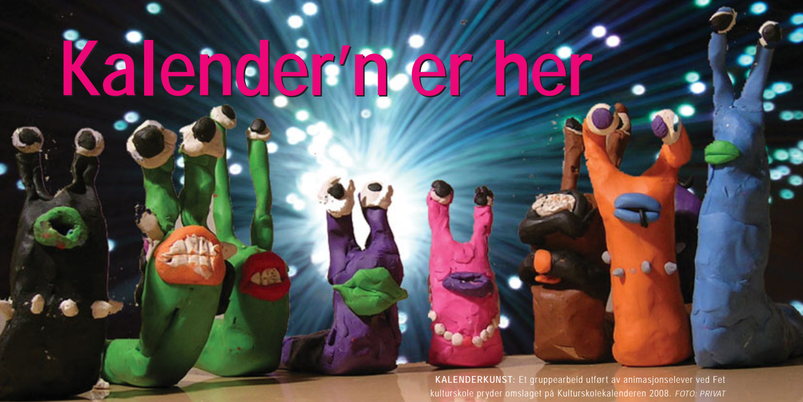
KALENDERKUNST: Et gruppearbeid utført av animasjonselever ved Fet kulturskole pryder omslaget på Kulturskolekalenderen 2008.

TRONDHEIM: Den nasjonale Kulturskolekalenderen 2008 er ferdig juryert og produsert, og på markedet tidnok til å bli for eksempel en fin julegave til kulturskolevenner og mange andre som kanskje ennå ikke kjenner skoleslaget så godt.