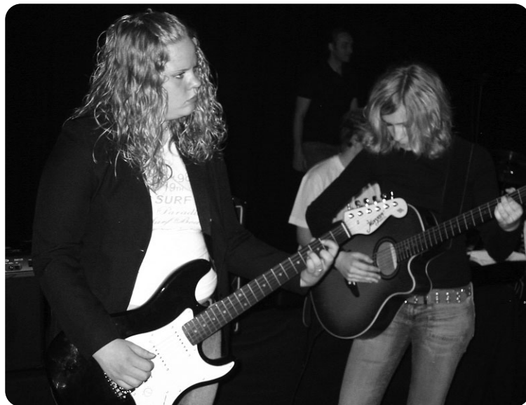
ATYPISK: Få jenter velger seg gitar og el-bass.

Hun mener det er naivt å tro at det først er i voksen alder at yrkesvalgene blir tatt, og at påvirkningen man blir utsatt for på musikkskolen er avgjørende for fremtidig musikkkarriere.