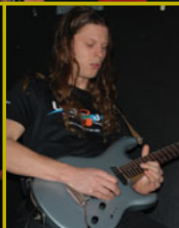
UMOJAGLIMT: Campdeltakerne viste sin kunster på en rekke skolekonserter.