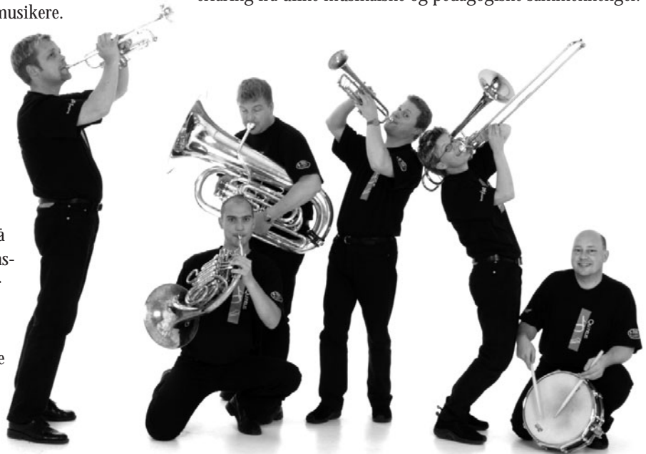
SAMISK-INSPIRERT: Tredje cd fra Quintus har samisk preg fra ende til annen.

Quintus sier sjøl de spiller humor- og stemningsfull egenarrangert/-komponert musikk basert på folkemusikk fra inn og utland. Samtlige i bandet er musikkutdannet og har bred erfaring fra ulike musikalske og pedagogiske sammenhenger.