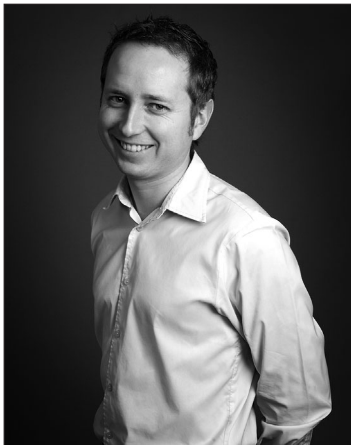
UROET STATSRAÐ: - Jeg er uroet over prisenivået i de kommunene som krever mest skolepenger i kulturskolen, sier den ferske kunnskapsministeren Bård Vegar Solhjell.

– Fra 1. januar 2004 ble det øremerkede tilskuddet til kulturskoler innlemmet i kommunenes inntektssystem. Vi må følge utviklinga på pris. Jeg er uroet over prisenivået i de kommunene