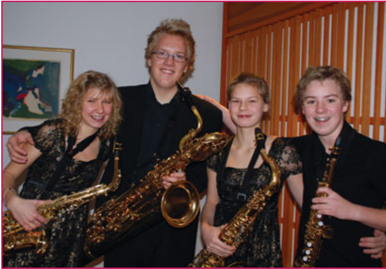
GODT HUMØR: Saxarella fra Østfold hadde det artig som deltaker i ensembleklassen.