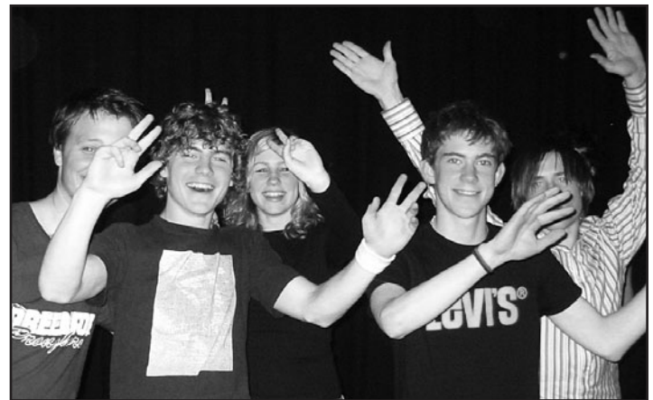
KAN JUBLE: Steinkjer kulturskoleelever har jublet før, og kan juble igjen. Lærerne deres får delta i KOM! Trøndelag, noe som også elevene helst skal merke positivt. ARKIVFOTO