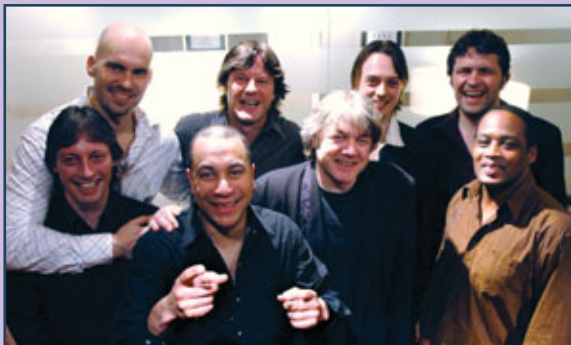
KOMMER: Mambo Compañeros skal ha eget nummer samt kompe andre.