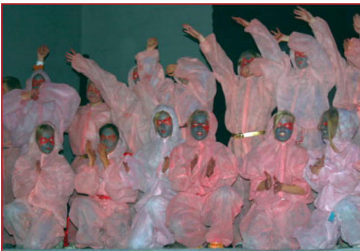
FARGER: Resultatet av KOMs-prosjektet er at den grå sekkefabrikken er blitt fylt med farger.

Det var ikke fritt for at instruktører, lærere og elever var spente før forestillingen. Det gikk hett for seg da alle de 210 elevene fra sjette- og sjuendeklasse ved de tre skolene skulle sminkes og få på seg kostyme samtidig. Det var minst like hektisk som den gang Sekkefabrikken var i drift, men denne gangen ble nok produktet atskillig mer fargerikt. Ved inngangen kunne publikum se utstillingen med foto fra prosessen og alle øvingene gruppevis.